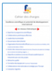
CAHIER DES CHARGES RESEAUX

F-CRIN comprend également 2 réseaux d'expertises spécialisées pour l'accompagnement de projet de recherche clinique dans les domaines spécifiques des maladies rares et des dispositifs médicaux .